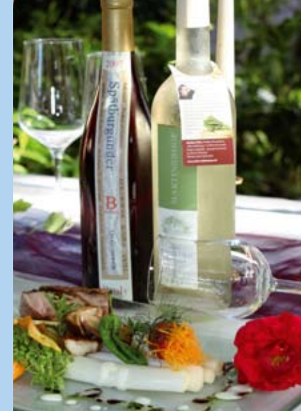
Restaurant Altes Kelterhaus

Spüren Sie die Wohltat unserer Verwöhnrituale mit unserer Naturkosmetik VINO LAY M