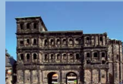
Porta Nigra in Trier

Beauty und Landschaft, eine hervorragende Verbindung an einem romantischen Ort.