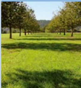
Wiesen & Wälder